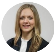
SINA WANS sustainable thinking Risikomanagement/ Nachhaltigkeit

Starten Sie noch heute mit unserem Team aus Klima- und Risikoexpertinnen, um Ihr Unternehmen zukunftsfähig aufzustellen.